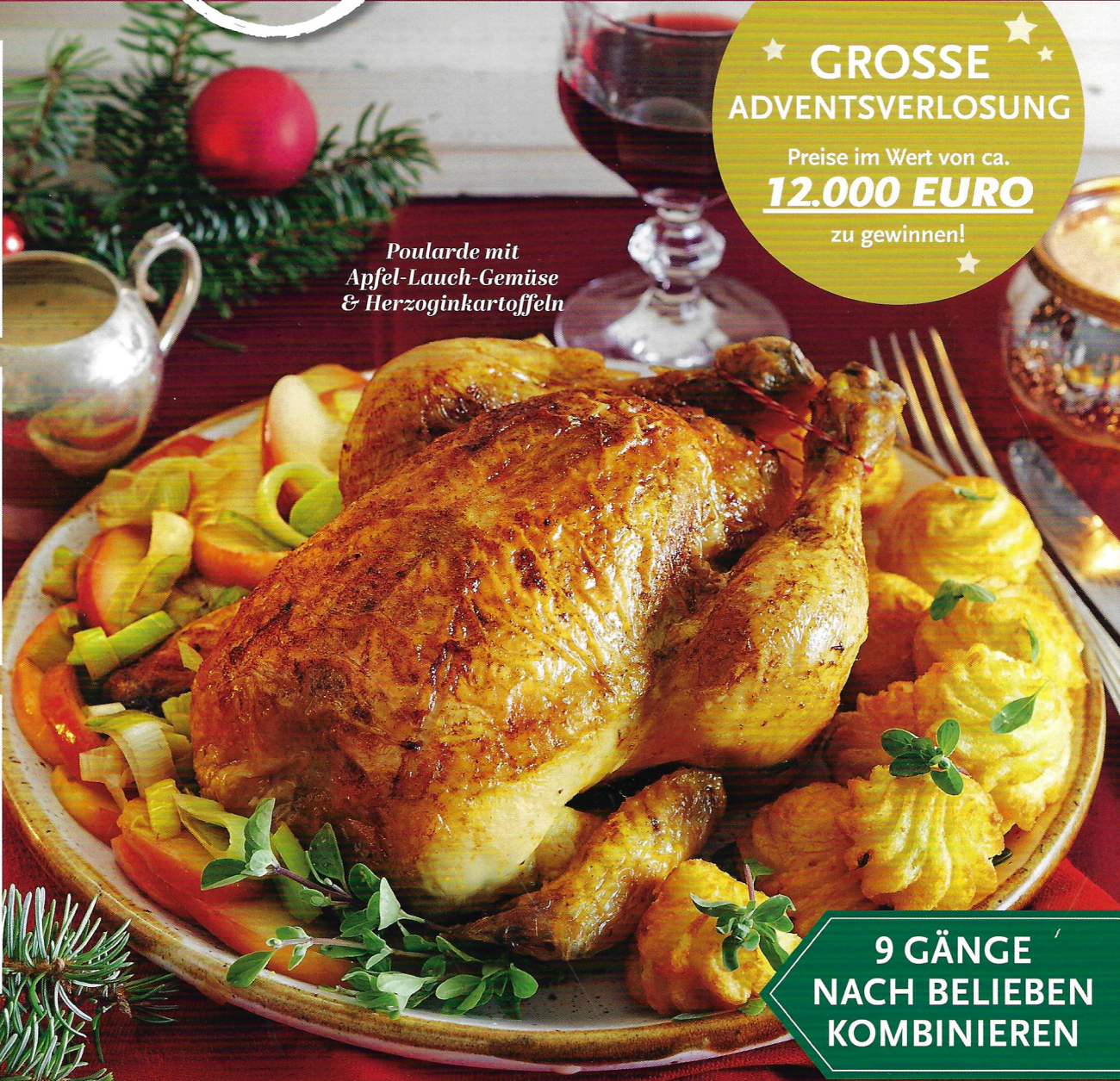
Poularde mit Apfel-Lauch-Gemüse & Herzoginkartoffeln

★ GROSSE ★ ADVENTSVERLOSUNG Preise im Wert von ca. 12.000 EURO zu gewinnen! ★