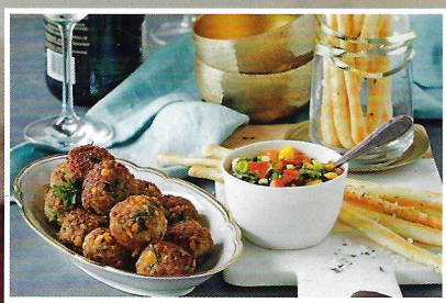
Ideen fürs Silvesterbüfett Kleine Häppchen & Getränke

www.landgenuss-magazin.de | November/Dezember | 4,99 EURO